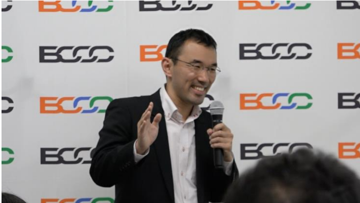
アプリの概要についてプレゼンする弊社エンジニア

このようにブロックチェーン技術を活用することにより、大規模なキャンペーンでもスムーズかつ低コストで実現でき、抽選の公平性を保つことができるくじアプリを開発することができました。